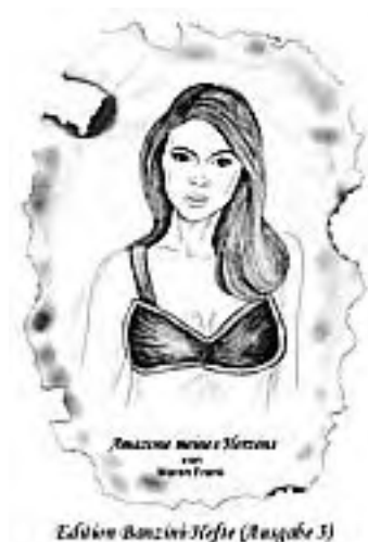
Edition Banzini-Hefte (Ausgabe 3)

Wirklich überzeugen kann der Roman aber nicht, da in der extrem lang gezogenen Handlung nicht viel passiert und die am Ende präsentierte Lösung die meisten Leser eher enttäuschen, als beeindrucken dürfte, denn im Prinzip ist sie weder Fleisch noch Fisch und wirkt eher so, als sei der Autorin nichts Besseres eingefallen, als die Helden in einem weiteren Paradies zu parken. (CS)